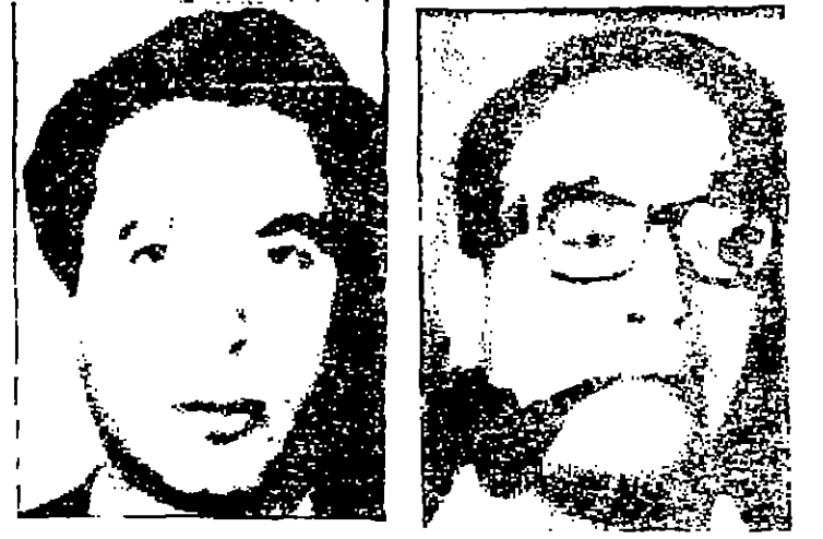
الاستاذ المبرمان الميمان بالجنس خمر عبد الفتى وعلى محمود علسي